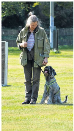
Die Kurse sorgen dafür, dass Hund und Herrchen oder Frauchen ein Team werden.

■ Alle weiteren Informationen gibt es auf der Internet-Homepage des Vereins unter sv-og-bamenohl.de