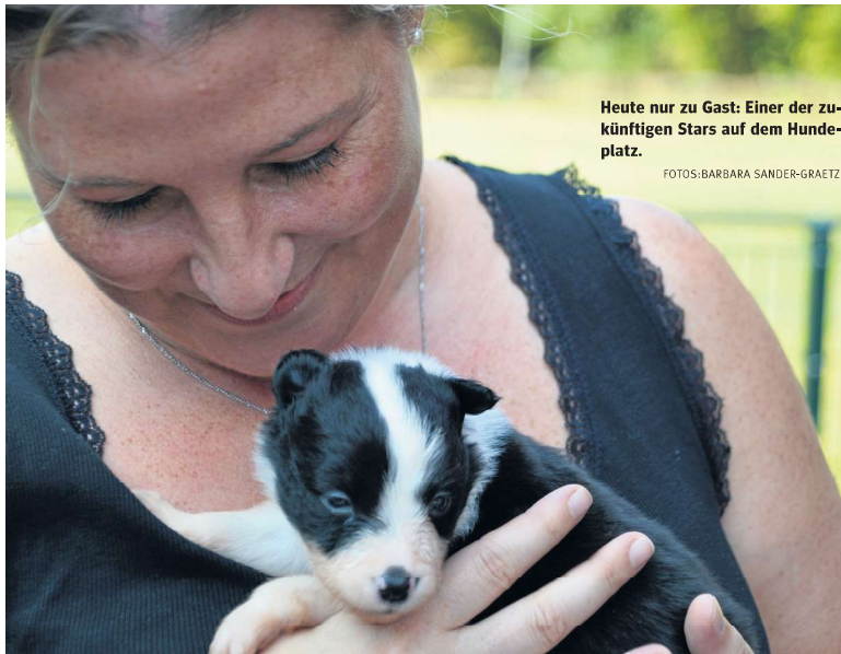
Heute nur zu Gast: Einer der zukünftigen Stars auf dem Hundepplatz.